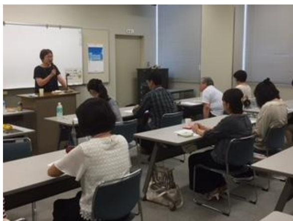
アサーション講座 in 徳島