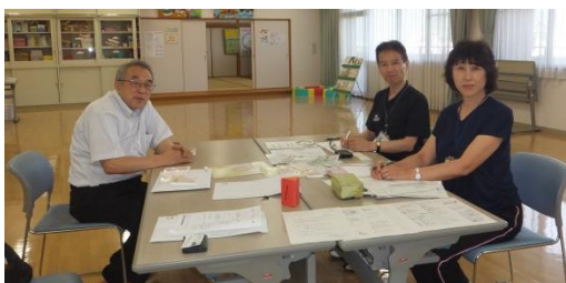
小原会長と大洲市社会福祉協議会へ

担当の方々の表情からは、疲労の色は隠せませんでした。今回は局所的な被災であったことからお互いに協力して取り組めたことや、この体験を踏まえて今後は南海トラフなど広い地域に影響する自然災害にも備えていきたいなどの強い思いも伝わってきました。微力ながら被災地の方々やサポートを続ける方々への支援や心のケアに繋がればと思いました。