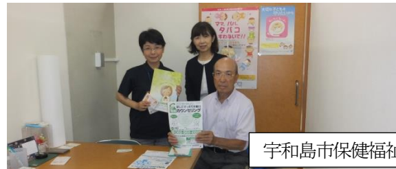
宇和島市保健福祉部