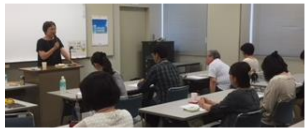
アサーション講座