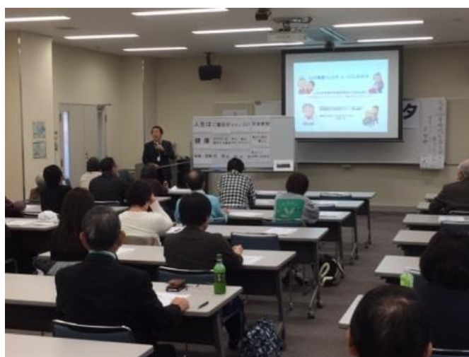
「心の健康フェスタ in とくしま 2018」11月25日（日）