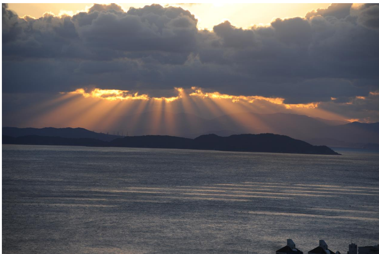
支部自慢フラッシュトーク用提供写真 淡路島から紀淡海峡を臨む